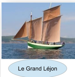
Le Grand Léjon

A la date du 1er mai, nous avons enregistré l'inscription de 37 bateaux dont: