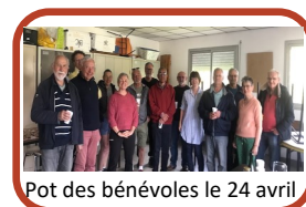
Pot des bénévoles le 24 avril